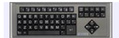
(versione Black con tasti neri e lettere bianche)